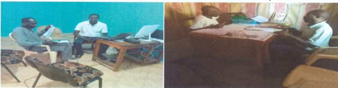
Entrevista a técnicos de radio Blouf FM y radio Awagna FM

Podemos mencionar que la sensibilización radiofónica ha permitido de conocer mejor las prácticas de gestión y explotación sostenible de los recursos gracias a las emisiones de la radio Blouf FM y Awagna radio. De hecho, estas emisiones han permitido de conocer mejor cómo proteger los bosques. Así, la sensibilización ha sido eficaz mediante emisiones realizadas y grabadas en las aldeas y retransmitidas en emisiones de radio. Cabe señalar que la radio Blouf ha realizado 6 emisiones en los 2 municipios (Mangagoulack y Mlomp), a razón de 3 emisiones realizadas en cada municipio. Por otra parte, la radio Awagna ha realizado 17 emisiones. Podemos notar que la radio Blouf FM tiene cobertura geográfica en toda la región de Ziguinchor, parte de Gambia y de Guinea Bissau. Por otro lado, radio Awagna cubre todo el departamento de Bignona y también emite hasta Mbour, Gambia, Fatick y Guinea Bissau.