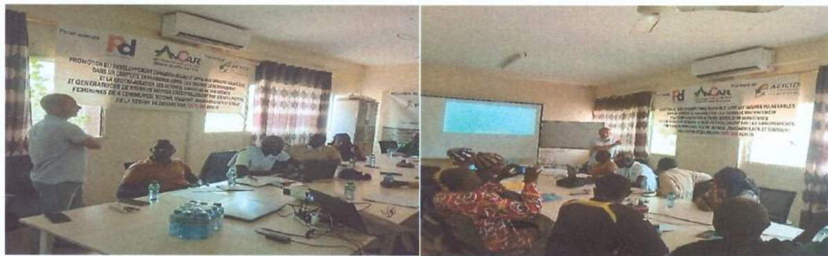
Taller de presentación y difusión de los resultados de evaluación.

Del mismo modo, las intervenciones de los CARs y del responsable de los CAR han podido aclarar sobre muchos aspectos relacionados con el proyecto. También, los participantes indicaron que al final del proyecto, corresponde al municipio asumir la continuidad de los logros del proyecto.