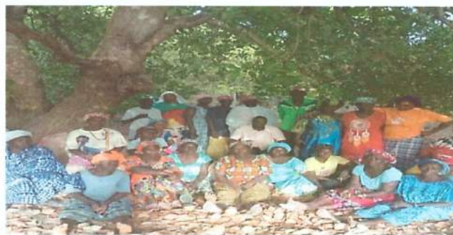
Entrevista a mujeres y hombres del perímetro de Mangagoulack

También, el establecimiento de viveros ha mejorado la reproducción de plantas para los perímetros agrícolas y la reforestación de la zona. Así que, el proyecto ha capacitado a 2 personas en cada GPF de los municipios, quienes a su vez han duplicado la formación a los demás miembros. Los viveros han sido las especies como el "ditaxx", "nééré", "khay", moringa y se han distribuido a las poblaciones.