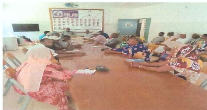
Entrevista al alcalde y a los concejales de la comuna de Mlomp

En cuanto a las autoridades locales, como los ayuntamientos, se comprometen a mantener los resultados obtenidos una vez finalizado el proyecto. Como resultado, podrán apoyar a la población local una vez que se termina el proyecto.