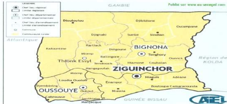
Mapa de la región de Ziguinchor

La región de Ziguinchor está ubicada en Baja-Casamance, en el sur del país y limitada al norte por Gambia, al sur por Guinea-Bissau, al este por las regiones de Kolda y Sédhiou y al oeste por el Océano Atlántico. Se compone de 3 departamentos: los departamentos de Oussouye, Ziguinchor y Bignona donde ha sido implementado el proyecto.