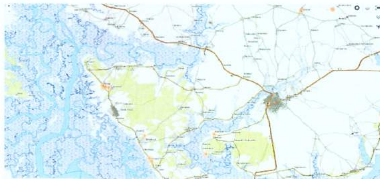
Mapa del área de investigación y evaluación.

Las encuestas con mujeres y hombres han sido realizadas en los perímetros agrícolas, los miembros de los CLCOP y unas familias en los 4 municipios y aldeas de intervención, precisamente en las zonas agrícolas de Ediamath, Diandialatte, Djibiack (Tendouck) y Djiniper. A continuación presentamos la zona en la que se han realizado las encuestas: