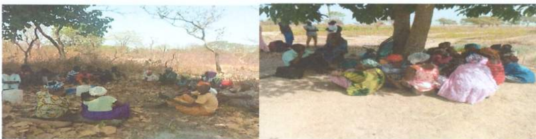
Grupos de discusión en los perímetros agrícolas de Ediamath (Mlomp) y Diandialatte (Niamone)

El trabajo realizado es una evaluación final externa. La metodología aplicada ha sido mixta cuantitativa y cualitativa con una revisión documental. Además, se ha recopilado información durante las visitas de campo con entrevistas individuales, grupos de discusiones y encuestas. Las preguntas y el lenguaje se han adaptado a los grupos de participantes para garantizar su comprensión involucrándolas y han permitiendo su participación en el proceso de recopilación de información. La metodología ha respetado la aplicación de los criterios de evaluación de proyectos mencionados en los TdR. Por eso, para cada criterio, se han formulado varias preguntas para ver cómo y de qué manera el proyecto ha afectada a cada grupo. Además, el proyecto ha integrado el enfoque de género y tenido en cuenta las necesidades e intereses estratégicos de mujeres y hombres.